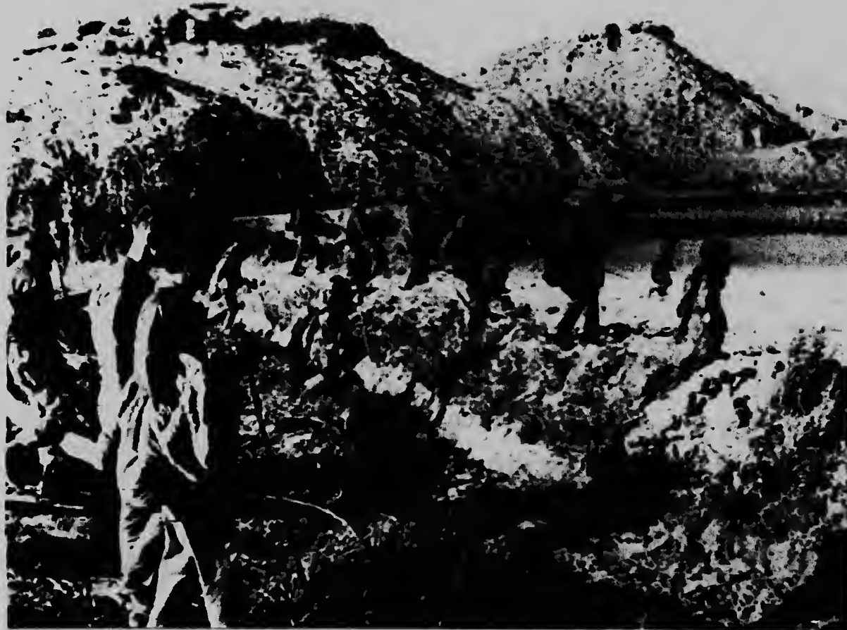
PALOMARES ESPANJA--Soldados norteamericanos ta continuando buscando e arma atomico cu a ser perdi for di e Bombardeo B-52 cu a cai despues di a dal den laria cu un otro avion. Autoridadnan di Forsa Aerea di Merca a asegura cu lo no tin peliger cu e arma atomico lo explota.